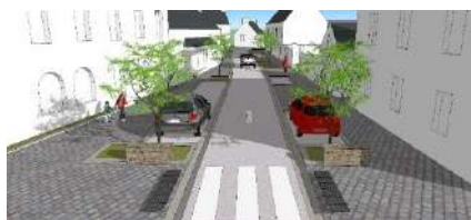
Rue Joseph Kerain