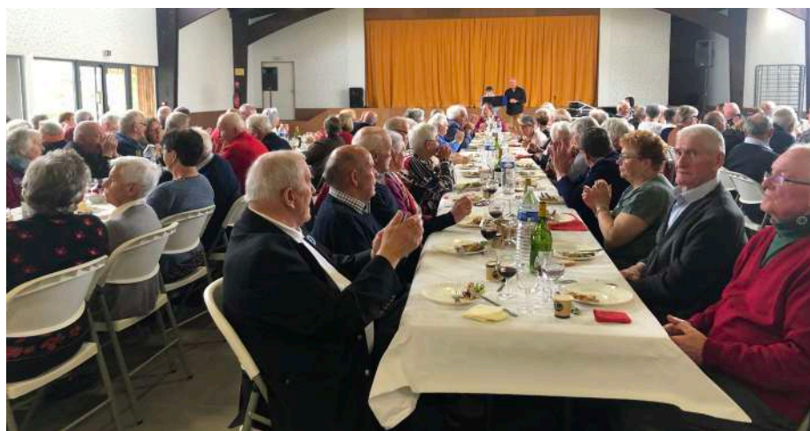
Repas des anciens le 8 mai 2022