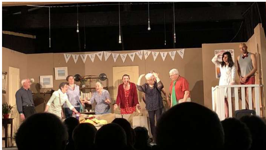
La troupe des Pièces montées de retour sur scène pour « Le bal des escargots »

Les rassemblements, réceptions ou autres festivités sont de retour après deux années. Petite rétrospective de l'actualité prataise des 6 derniers mois.