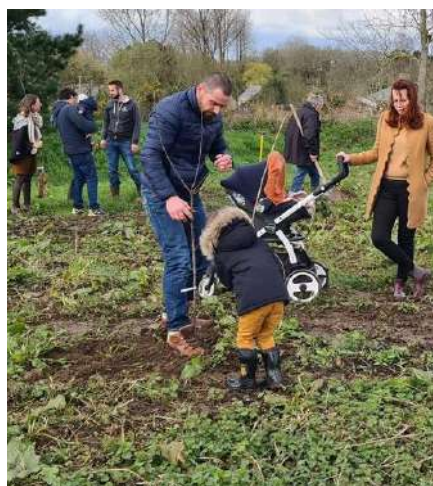
Plantation arbres fruitiers nouveaux nés