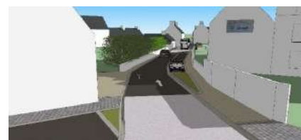
Rue Julien Marie Le Houerou