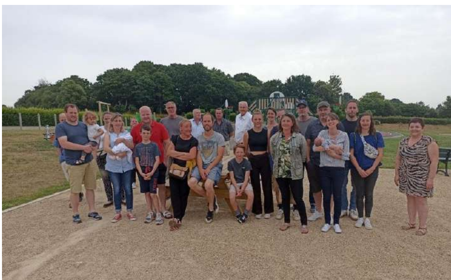
Pot d'accueil des nouveaux habitants, le 18 juin 2022